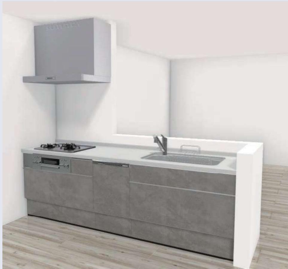
※CG合成によるイメージ画像です。現場調達品、シリーズ外選定品に関しては表現しておりません。